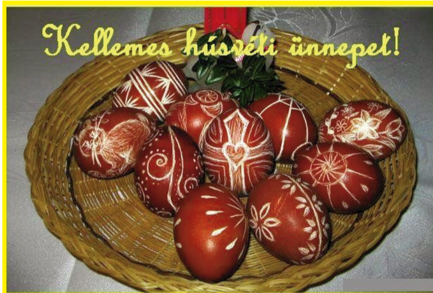
Az Uzoni Önkormányzat

Felhívjuk minden mezőgazdasági földterülettel rendelkező tulajdonos figyelmét, akinek nincsen semmilyen pénzügyi elmaradása (adóssága) az Uzoni Polgármesteri Hivatallal szemben, hogy írásos kérésben igényelheti a települések közelében elhelyezkedő mezőgazdasági területek külterületi (teren extravilan) státusából belterületbe (teren intravilan) való átsorolást. E kéréseket bukaresti vegyes bizottság fogja elbírálni. A kérések leadási határideje 2013. május 1.