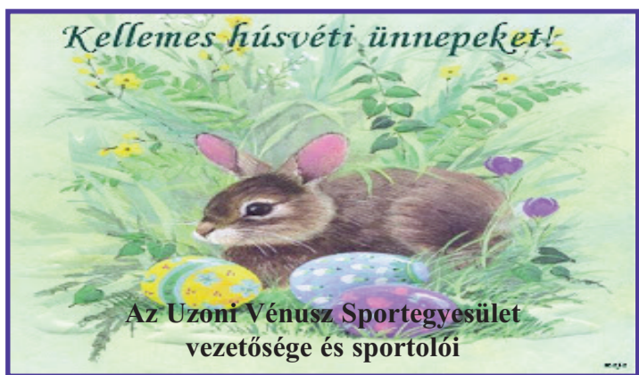
Az Uzoni Vénusz Sportegyesület vezetősége és sportolói