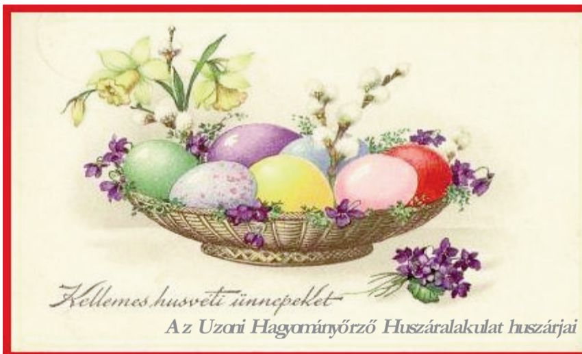
Az Uzoni Hagományörző Huszáralakulat huszárai