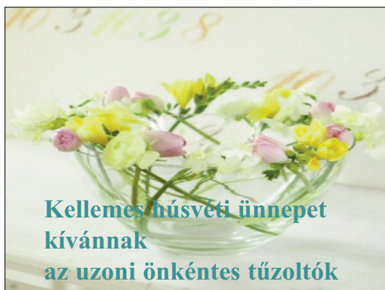
Kellemes húsvéti ünnepet kívánnak az uzoni önkéntes tűzoltók