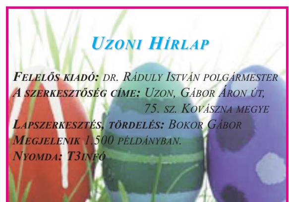
UZONI HÍRLAP FELELŐS KIADÓ: DR. RÁDULY ISTVÁN POLGÁRMESTER A SZERKESZTŐSÉG CÍME: UZON, GÁBOR ÁRON ÚT, 75. SZ. KOVÁSZNA MEGYE LAPSZERKESZTÉS, TÖRDELÉS: BOKOR GÁBOR MEGJELENIK 1.500 PÉLDÁNYBAN. NYOMDA: T3INFO