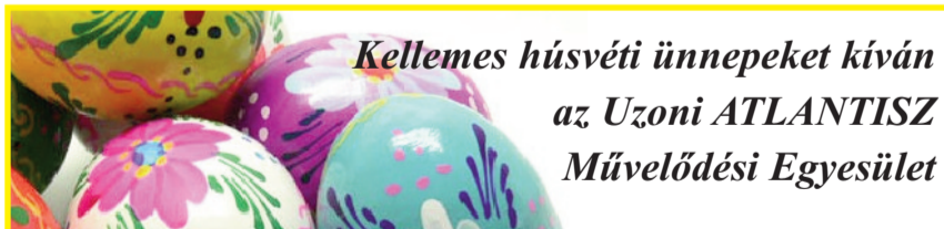
Kellemes húsvéti ünnepeket kíván az Uzoni ATLANTISZ Művelődési Egyesület