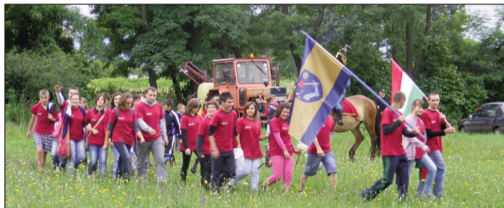
A FALUNAPON VONUL A SZI@ CSAPATA