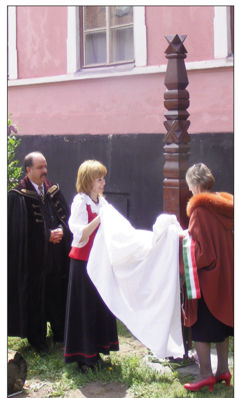
KOPJAJA AVATÁS AZ ISKOLA UDVARÁN, A TAVALYI ISKOLANAPOK ALKALMÁVAL

Áldott húsvétot kívánok, magam és az uzoni iskola munka-közössége nevében mindannyiuknak.